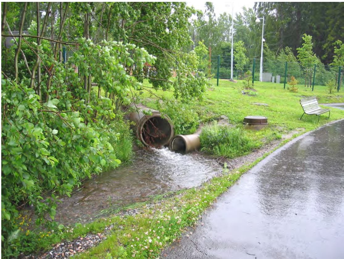
Kuva. Hulevesiviemärointiä Keski-Helsingissä