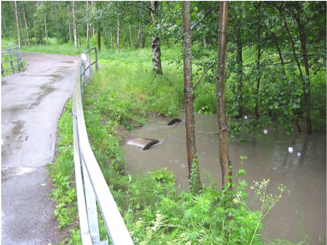
Kuva. Hulevesitulva Mustapurossa