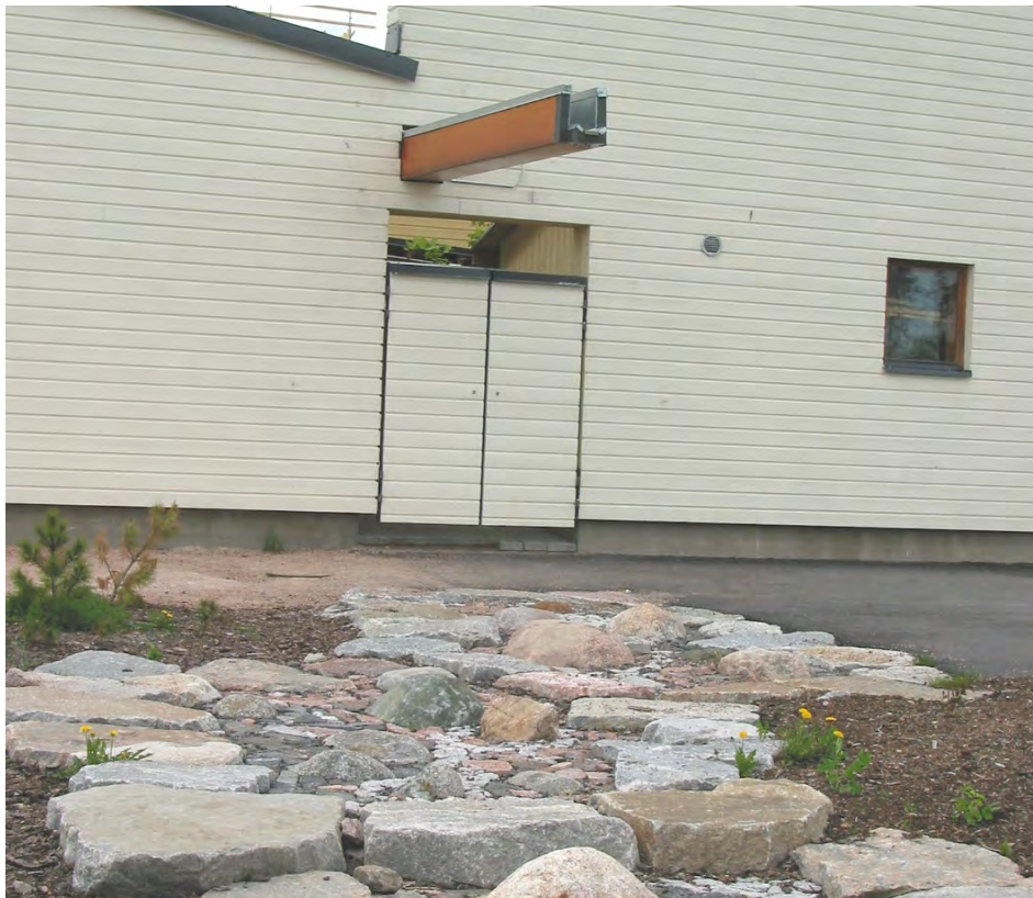
Kuva. Kattovesien johtamista Koillis-Helsingissä (rakennusvirasto)