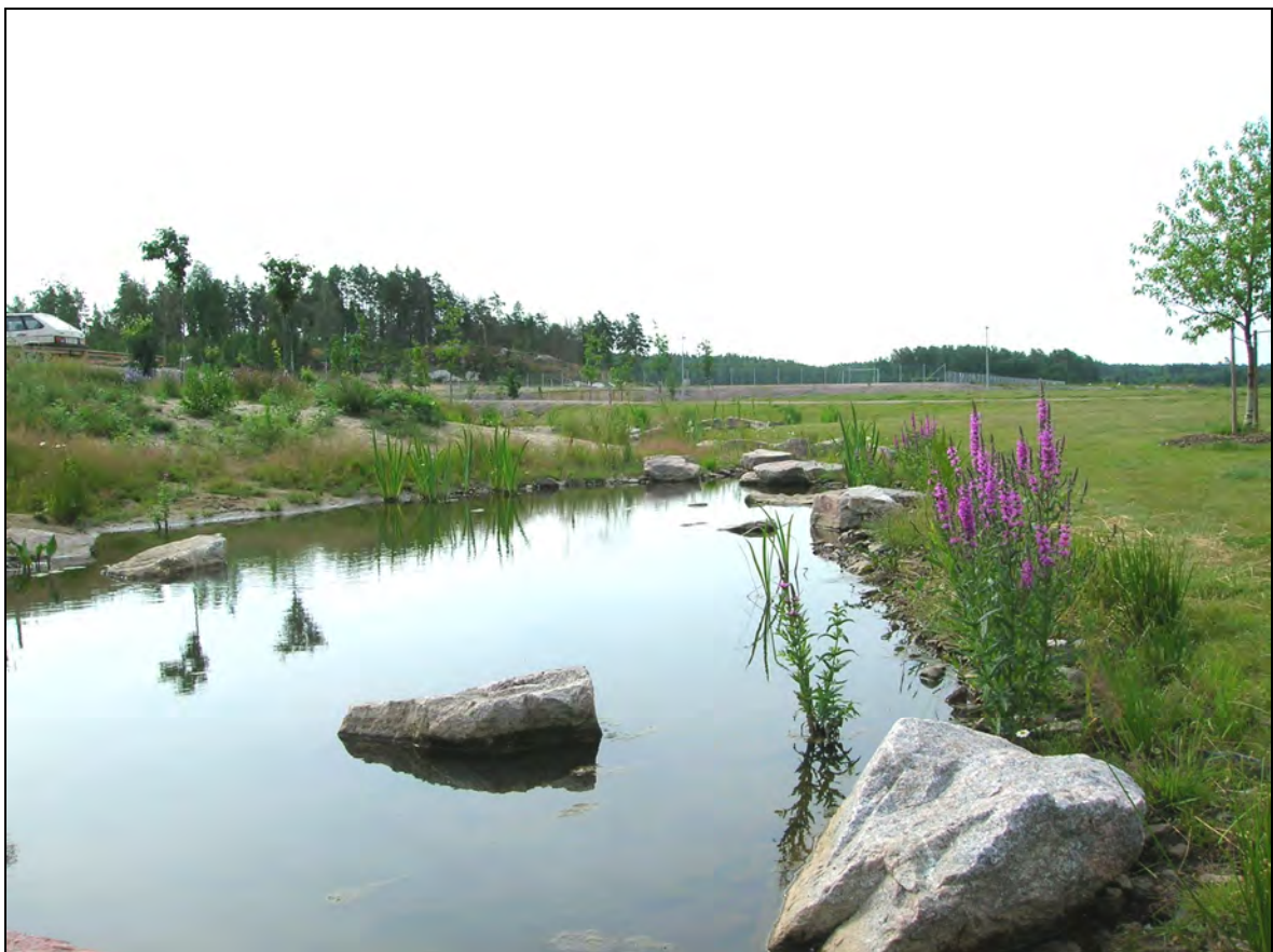
Kuva. Luonnonmukaistettua Viikinojaa (rakennusvirasto)